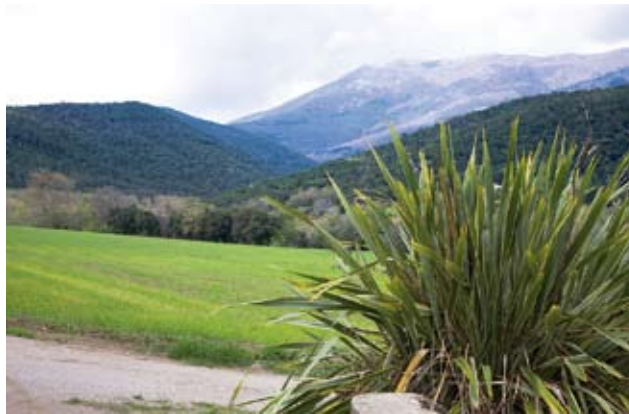
Camp a prop de Santa Magdalena

Vista del massís del Montseny des d'els Bruguers