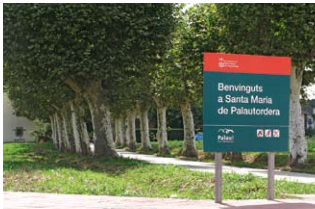
Passeig del Remei - Santa Maria de Palautordera